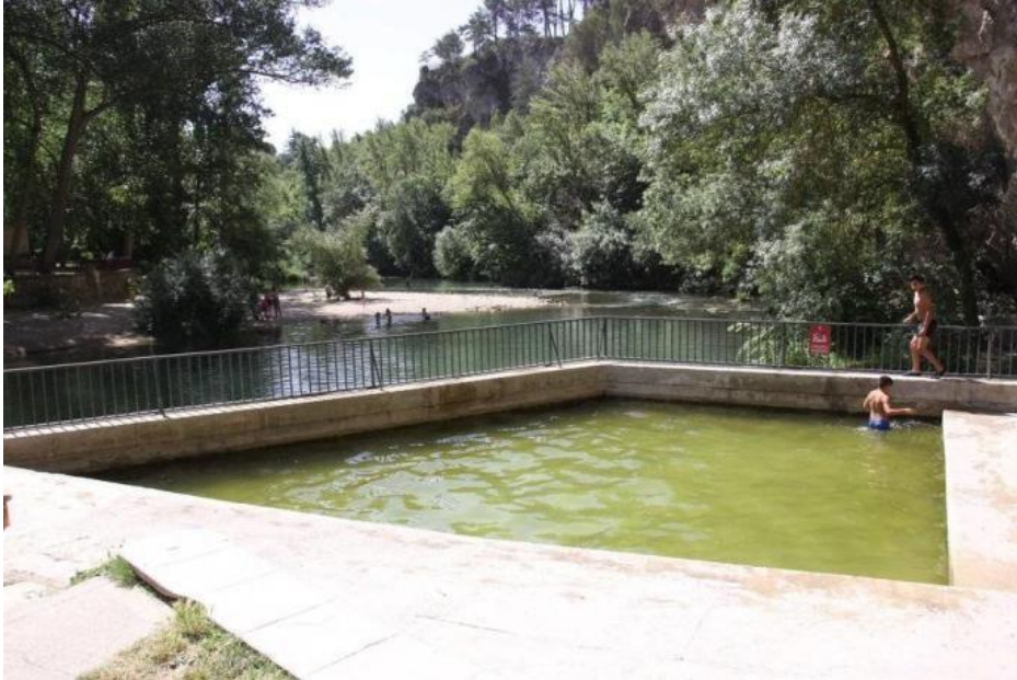
Mota: Iturburua | Kokapena: Lizarra

Putzu hori betetzen da igeltsuz eta karbonatoz betetako akuifero batetik datorren urarekin. Beraz, gatz kontzentrazio handia du, eta ura termala da nolabait. Uraren temperatura konstantea da urte osoan (udan, 17°C-tik 18°C-ra), eta, beraz, eremu hori asko erabiltzen da urtaro guztietan. Tradizioaren arabera, urak sendatzaileak dira, batez ere larruazaleko gaixotasunetarako.