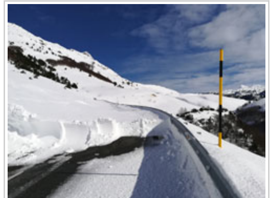
Puerto de Belagua.

Las carreteras NA-137, por el Puerto de Belagua, y la NA-200 Isaba-Zuriza desde el km 6, estarán cerradas mientras permanezca la previsión meteorológica que anuncia un riesgo de aludes para los valles del nordeste de Navarra. El nivel de riesgo se cifra en 3/5 para cotas inferiores a 1.800 metros y 4/5 para las superiores, al menos hasta este miércoles.