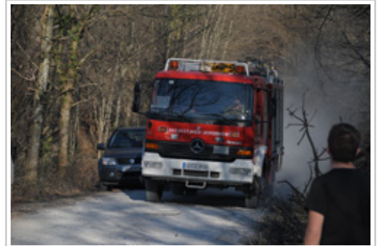
Un vehículo de los bomberos voluntarios de Goizueta se dirige al lugar del incendio.