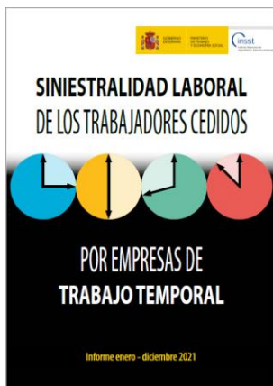
Siniestralidad laboral de los trabajadores cedidos por empresas de trabajo temporal INSST