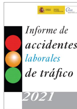
Informe de accidentes laborales de tráfico 2021 OIT