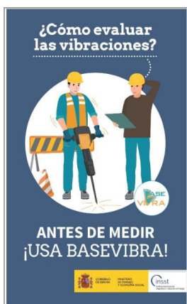
¿Cómo evaluar las vibraciones? Antes de medir ¡Usa basevibra! INSST