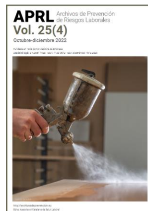
Archivos de Prevención de Riesgos Laborales (Vol. 25) APRL

El Instituto de Salud Pública y Laboral de Navarra (ISPLN) no se hace responsable de los contenidos de los artículos y noticias publicadas, las cuales han sido obtenidas tal y como aparecen en sus correspondientes páginas web, sin modificaciones ni añadidos, citando su procedencia. Si desea realizar cualquier consulta, sugerencia o no quiere recibir más información de este remitente, puede contactar con el ISPLN en el correo electrónico ispln.ufii@navarra.es