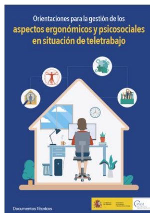
Orientaciones para la gestión de los aspectos ergonómicos y psicosociales en situación de teletrabajo INSST