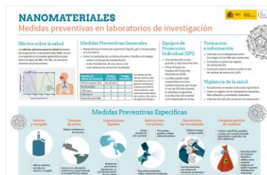
NANOMATERIALES. Medidas preventivas en la boratorios de investigación INSST

El Instituto de Salud Pública y Laboral de Navarra (ISPLN) no se hace responsable de los contenidos de los artículos y noticias publicadas, las cuales han sido obtenidas tal y como aparecen en sus correspondientes páginas web, sin modificaciones ni añadidos, citando su procedencia. Si desea realizar cualquier consulta, sugerencia o no quiere recibir más información de este remitente, puede contactar con el ISPLN en el correo electrónico ispln.ufii@navarra.es