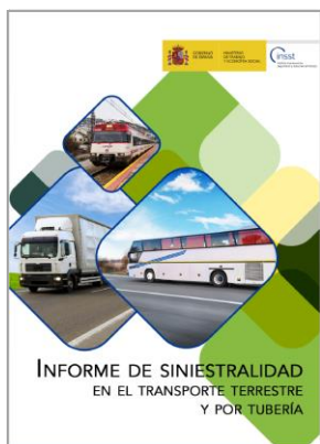
Informe de siniestralidad en el transporte terrestre y por tubería INSST