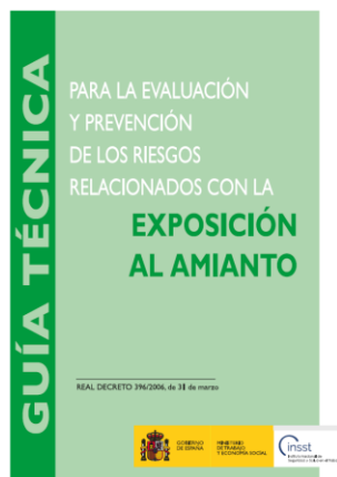
Guía técnica para la evaluación y prevención de los riesgos relacionados con la exposición al amianto - Año 2022 INSST