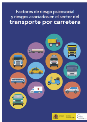
Factores de riesgo psicosocial y riesgos asociados al sector del transporte por carretera INSST