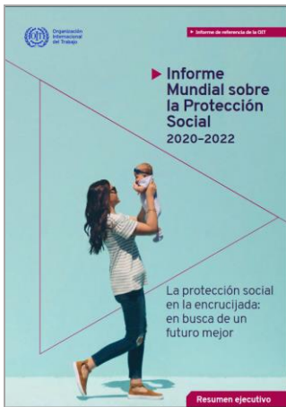
Informe Mundial sobre la Protección Social 2020-2022 OIT