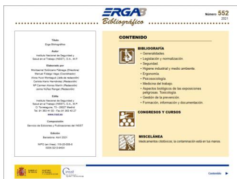
ERGA bibliográfico Nº 552 INSST