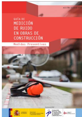
Guía de medición de ruido en obras de construcción FEPRL/FLC