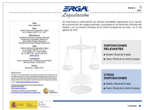
ERGA legislación Nº8 INSST

El Instituto de Salud Pública y Laboral de Navarra (ISPLN) no se hace responsable de los contenidos de los artículos y noticias publicadas, las cuales han sido obtenidas tal y como aparecen en sus correspondientes páginas web, sin modificaciones ni añadidos, citando su procedencia. Si desea realizar cualquier consulta, sugerencia o no quiere recibir más información de este remitente, puede contactar con el ISPLN en el correo electrónico ispln.ufii@navarra.es