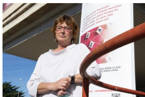
(I. Uriz/ Foku)