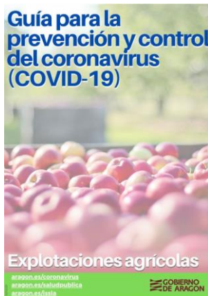
Guía para la prevención y control del coronavirus en explotaciones agrarias Gobierno de Aragón