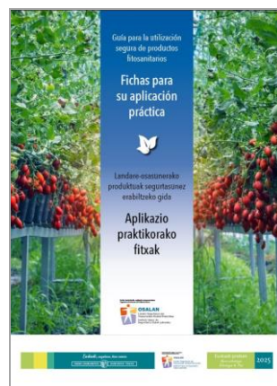
Utilización de productos fitosanitarios OSALAN