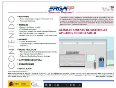
ERGA- Almacenamiento de materiales apilados sobre el suelo INSST

El Instituto de Salud Pública y Laboral de Navarra (ISPLN) no se hace responsable de los contenidos de los artículos y noticias publicadas, las cuales han sido obtenidas tal y como aparecen en sus correspondientes páginas web, sin modificaciones ni añadidos, citando su procedencia. Si desea realizar cualquier consulta, sugerencia o no quiere recibir más información de este remitente, puede contactar con el ISPLN en el correo electrónico ispln.ufii@navarra.es