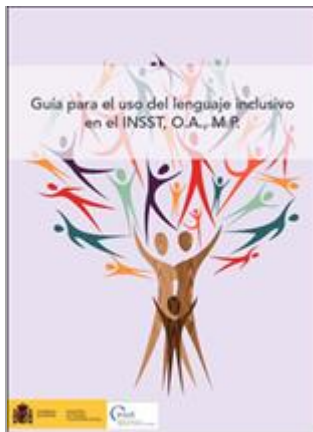
Guía para el uso del lenguaje inclusivo INSST