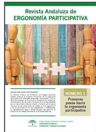
Revista andaluza de ergonomía participativa IAPRL