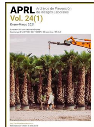
Archivos de prevención de riesgos laborales Revista APRL