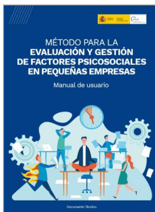
Método para la evaluación y de factores psicosociales en pequeñas empresas INSST