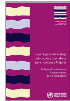
Guía para crear lugares de Trabajo Saludables y Equitativos para Hombres y Mujeres Organización Internacional del Trabajo