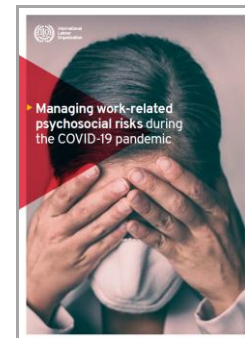
Gestión de riesgos psicosociales relacionados con el trabajo durante la pandemia de COVID-19 (en inglés) Organización Internacional del Trabajo

El Instituto de Salud Pública y Laboral de Navarra (ISPLN) no se hace responsable de los contenidos de los artículos y noticias publicadas, las cuales han sido obtenidas tal y como aparecen en sus correspondientes páginas web, sin modificaciones ni añadidos, citando su procedencia. Si desea realizar cualquier consulta, sugerencia o no quiere recibir más información de este remitente, puede contactar con el ISPLN en el correo electrónico bibliotecainsl@navarra.es