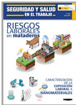
Seguridad y Salud en el trabajo INSST