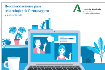
Guía didáctica de medidas de seguridad laboral para el teletrabajo AEPSAL