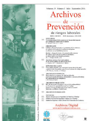
Archivos de prevención. 2019 Vol. 22, Núm. 3, Julio-septiembre