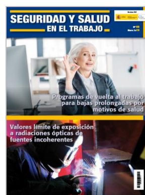
Revista INSST. Núm. 98