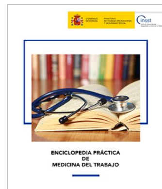
Enciclopedia Práctica de Medicina del Trabajo - Año 2019