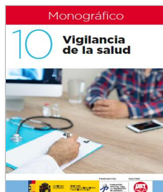
Monográfico sobre Vigilancia de la Salud