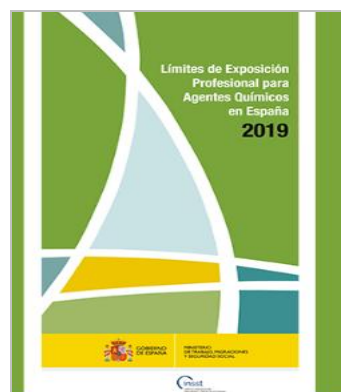
Límites de exposición profesional para agentes químicos 2019