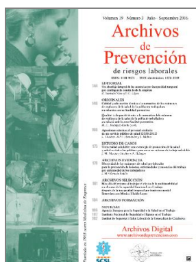
Archivos de prevención. 2019 Vol. 22, Núm. 1, Abril-junio