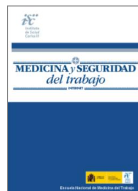
Medicina y Seguridad del Trabajo. Vol. 64. nº. 253, Octubre-diciembre 2018