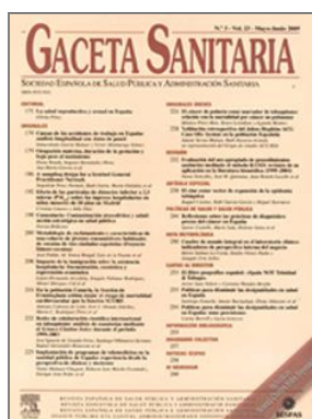
Gaceta Sanitaria. Vol. 33. Núm. 2. Mayo-junio 2019