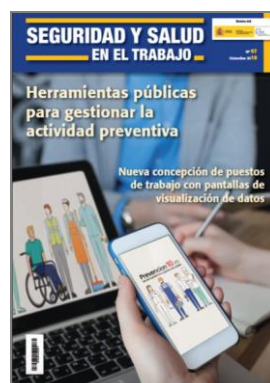
Revista INSST, nº 97