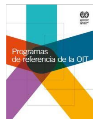
Programas de referencia de la OIT