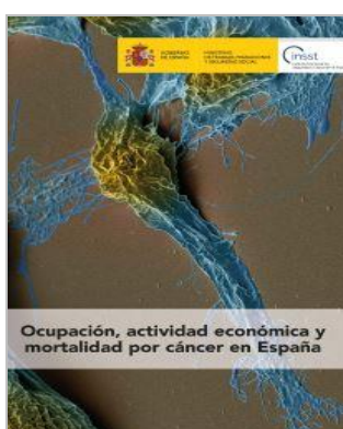
Nuevo Estudio del INSST: Ocupación, Actividad Económica y Mortalidad por Cáncer en España