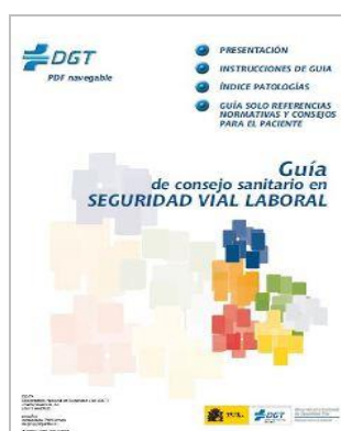
Seguridad vial laboral: Guía de consejo sanitario