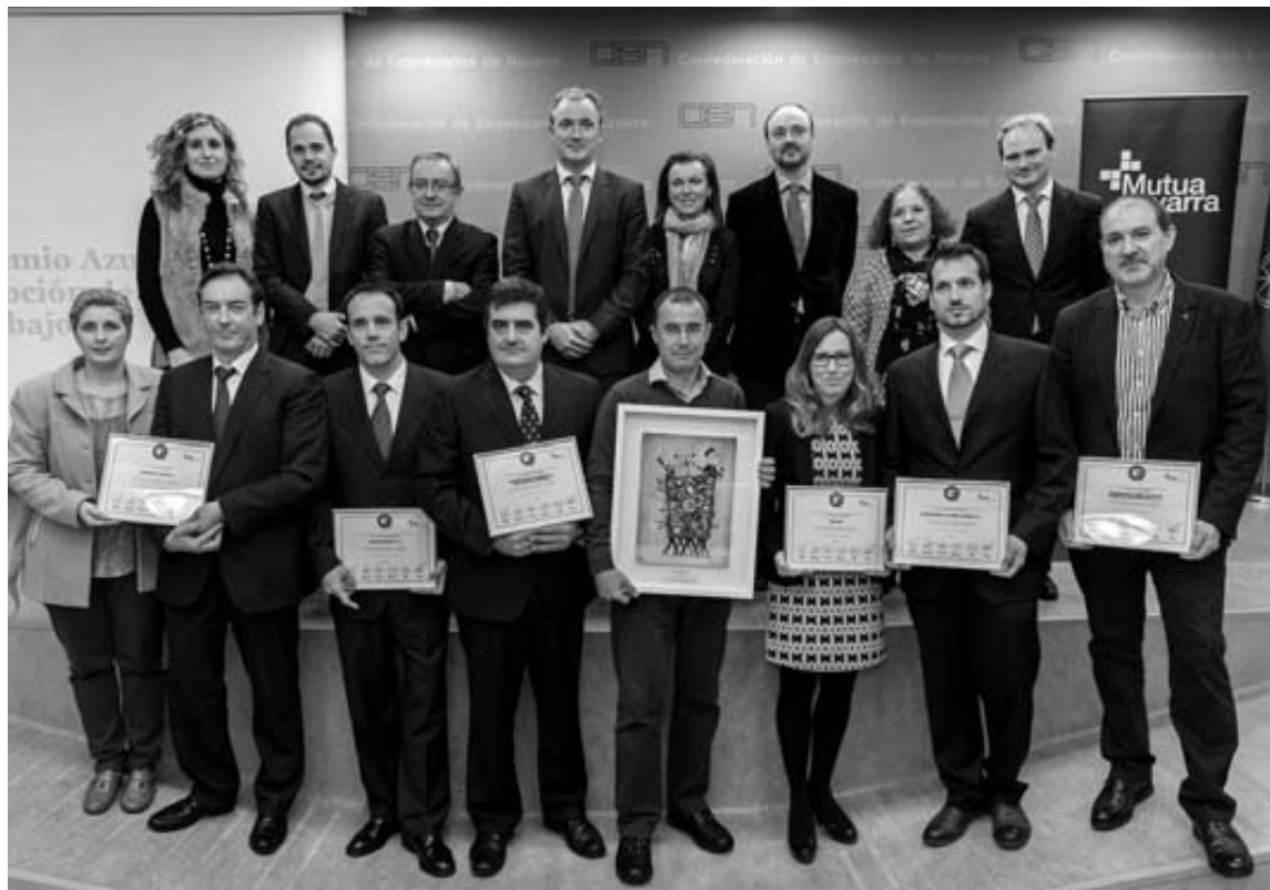
Premiados y responsables de Mutua Navarra y de la CEN ayer, durante la entrega de galardones.

Las empresas premiadas han destacado la importancia de asumir este tipo de acciones como parte de un plan o programa de iniciativas estudiadas, planificadas, contrastadas con los empleados e integradas como parte de la rutina de la empresa. Las implantación de medidas saludables en las empresas son fruto tanto de la iniciativa de la dirección como de los trabajadores, pero se está imponiendo con más fuerza cada vez un modelo de empresa que vela por tener una plantilla saludable, tanto física, mental como emocionalmente, que solicita su opinión y la implica en la toma de decisiones en los procesos donde es posible, como es el caso de las iniciativas saludables, añade Mutua Navarra.