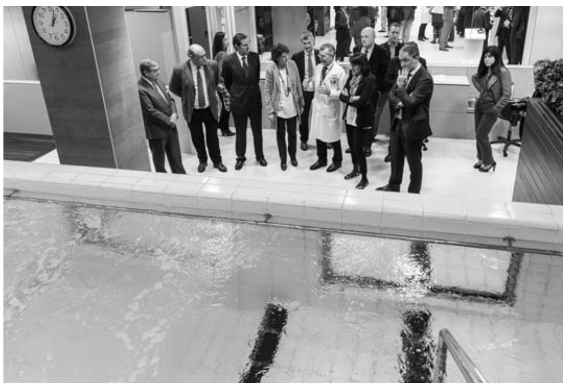
Autoridades y responsables de Mutua Navarra, ayer junto a la nueva piscina de rehabilitación.