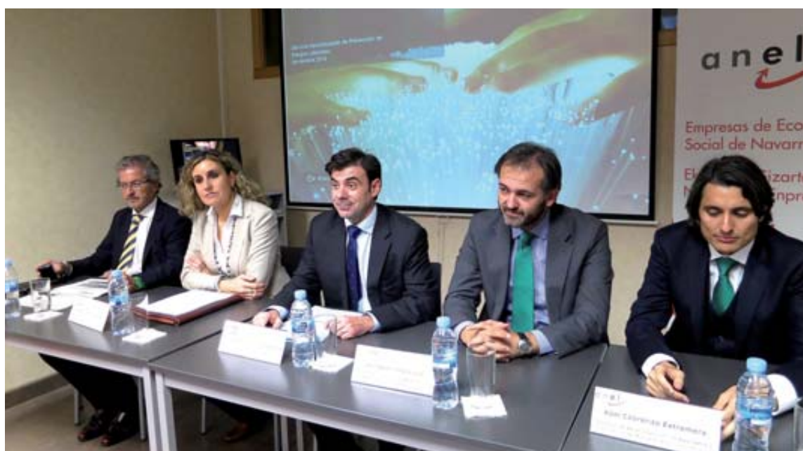
Los participantes en la mesa de trabajo organizada por Anel, la Asociación Navarra de Empresas Laborales.