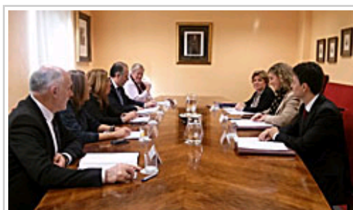
Reunión de la Comisión de Inspección de Trabajo.

Durante 2015, la Inspección de Trabajo aumentará sus actuaciones inspectoras en el campo de la prevención de riesgos laborales coincidiendo con el incremento de la actividad económica que se registra actualmente en todos los sectores, e introducirá, como novedad, controles en las condiciones de trabajo de menores, en el sector agrario y en lo relativo a los riesgos biológicos en el sector sanitario.