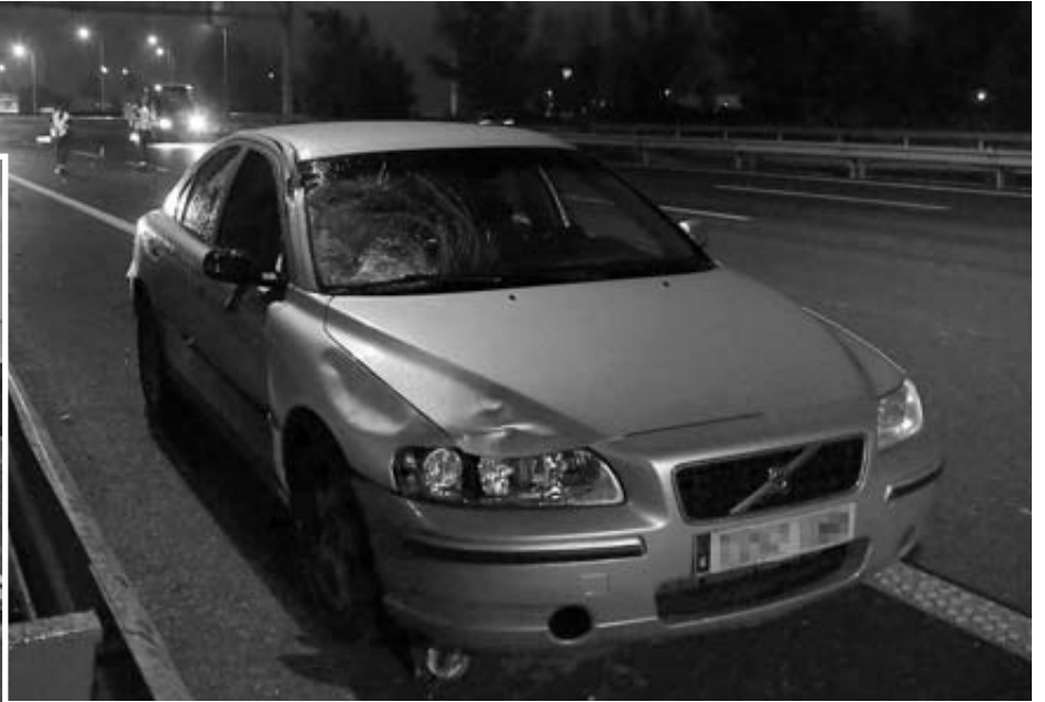
El suceso ocurrió a las 19 horas en el carril central de la autopista, en sentido sur (hacia Imárcoain). A la izquierda, el tramo de la vía donde tuvo lugar el accidente, paralelo al polígono de Talluntxe.