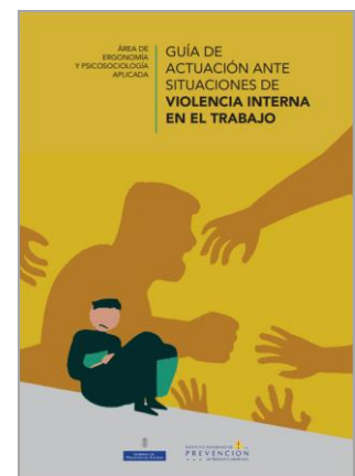
Guía de actuación ante situaciones de violencia interna en el trabajo IAPRL