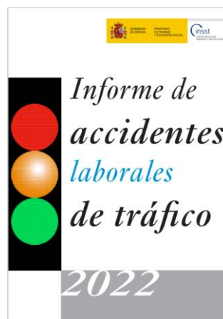
Informe de accidentes laborales de tráfico 2022 INSST