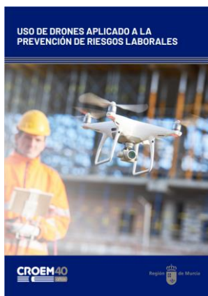
Uso de drones aplicado a la prevención de riesgos laborales CROEM - MURCIA