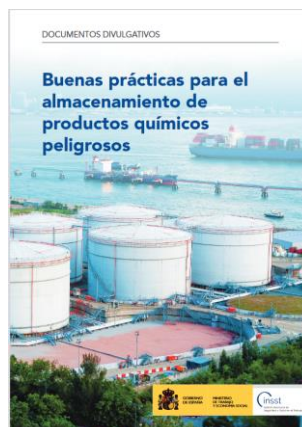
Buenas prácticas para el almacenamiento de productos químicos peligrosos INSTT