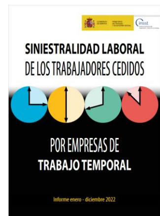
Siniestralidad laboral de los trabajadores cedidos por empresas de trabajo temporal INSST