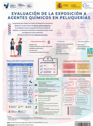
Evaluación de la exposición a agentes químicos en peluquerías INSST