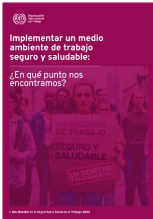
Implementar un medio ambiente de trabajo: seguro y saludable OIT