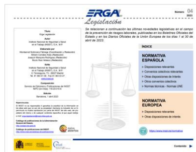
ERGA - Legislación Nº 4 - 2023

El Instituto de Salud Pública y Laboral de Navarra (ISPLN) no se hace responsable de los contenidos de los artículos y noticias publicadas, las cuales han sido obtenidas tal y como aparecen en sus correspondientes páginas web, sin modificaciones ni añadidos, citando su procedencia. Si desea realizar cualquier consulta, sugerencia o no quiere recibir más información de este remitente, puede contactar con el ISPLN en el correo electrónico ispln.ufii@navarra.es