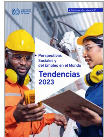
Perspectivas sociales y del empleo en el mundo – Tendencias 2023 OIT