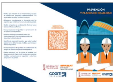
Prevención y Planes de Igualdad INVASSAT/ COGITI Valencia