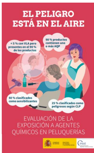
Evaluación de la exposición a agentes químicos en peluquerías – Año 2023 – INSST