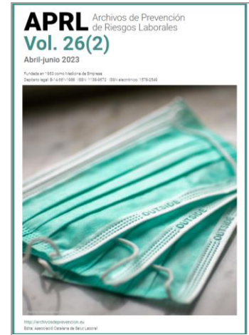
Revista APRL. Volumen 26 Associació Catalana de Salut Laboral