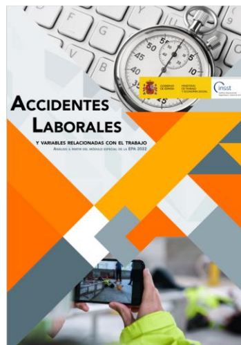
Accidentes laborales y variables relacionadas con el trabajo INSST