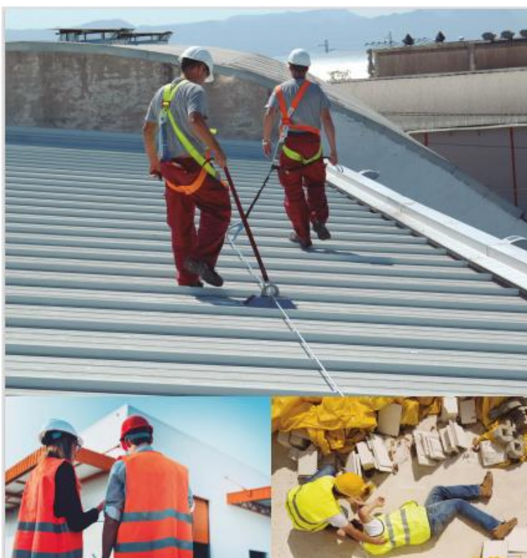
Campaña “Lo importante es bajar con vida”

La identificación de los riesgos y la definición de medidas preventivas, clave para prevenir los accidentes por caída desde cubierta. El Servicio de Salud Laboral insiste en la necesidad de que los propietarios de naves asuman su responsabilidad en la identificación de los riesgos y en la definición de medidas preventivas para el mantenimiento, acceso y realización de trabajos en cubiertas. Además, recuerdan que la situación de la cubierta debe ser incluida en la evaluación de riesgos que realizan los servicios de prevención.