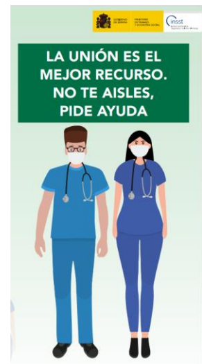
Folletto. La unión es el mejor recurso. No te aisles, pide ayuda INSST