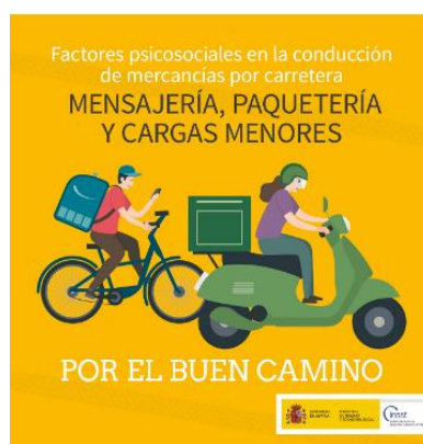
Factores psicosociales en la conducción de mercancías por carretera INSST