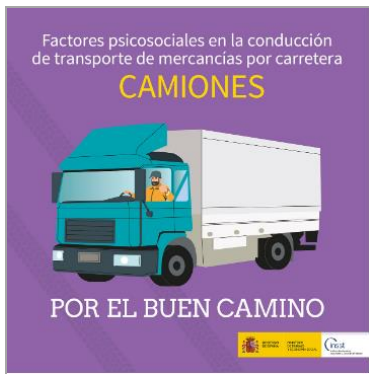
Factores psicosociales en la conducción de transporte de mercancías por carretera INSST