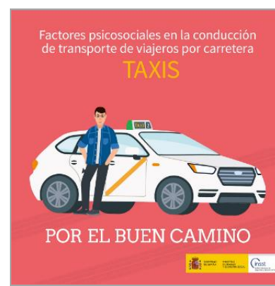
Factores psicosociales en la conducción de transporte de viajeros por carretera INSST