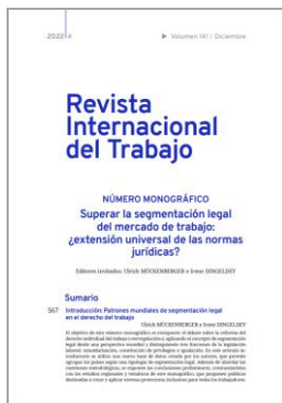
Revista Internacional del Trabajo OIT

El Instituto de Salud Pública y Laboral de Navarra (ISPLN) no se hace responsable de los contenidos de los artículos y noticias publicadas, las cuales han sido obtenidas tal y como aparecen en sus correspondientes páginas web, sin modificaciones ni añadidos, citando su procedencia. Si desea realizar cualquier consulta, sugerencia o no quiere recibir más información de este remitente, puede contactar con el ISPLN en el correo electrónico ispln.ufii@navarra.es