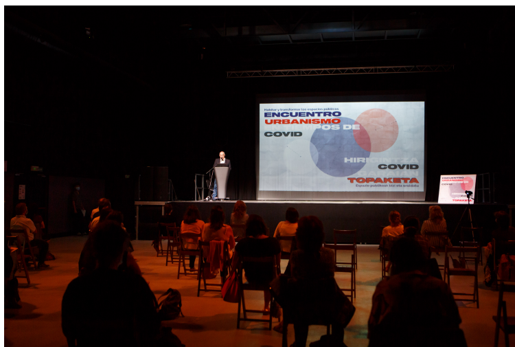
Publico asistente a las jornadas que también se pueden seguir vía streaming.